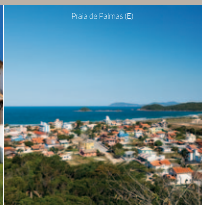
Praia de Palmas (E)