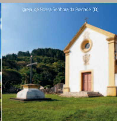
Igreja de Nossa Senhora da Piedade (D)