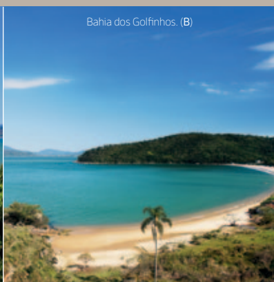
Bahia dos Golfinhos (B)